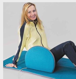
Kissen und Matte